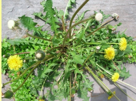
The only cure: Death 오직 치료 방법: 죽음