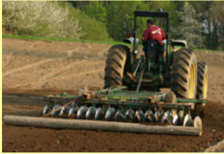
The only cure: Tilling 오직 치료 방법: 배양함