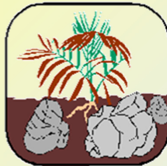
Rocky soil (돌밭)