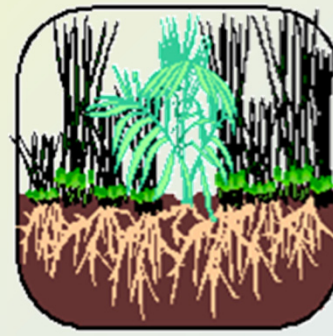
Among thorns (가시덤불)