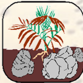
Rocky soil (돌밭)