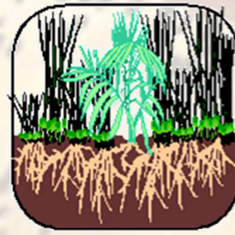
Among thorns (가시덤불)